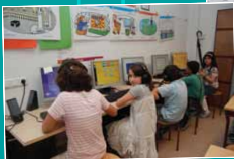
Alle leerlingen leren werken met de computer