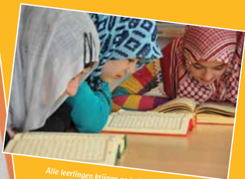
Alle leerlingen krijgen godsdienstonderwijs

Mijn vader komt uit Nederland M'n moeder uit Marokko Nou heb ik dus een vaderland Daar kun je 's winters sleeën En ook heb ik een moederland Met prachtige moskeeën Daar lekker elke dag couscous Hier weer patat met appelmoes Twee landen dat is dubbel fijn Ik ben blij dat ik mezelf mag zijn