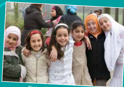
Kinderen hebben plezier op school