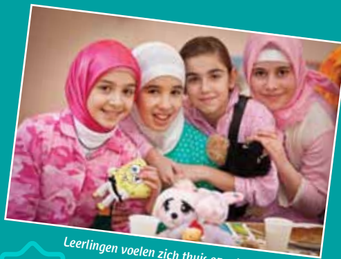
Leerlingen voelen zich thuis op school