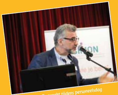
CvB spreekt tijdens personeelsdag