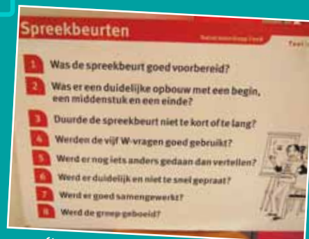
Stappenplan spreekbeurt groep 7 en 8