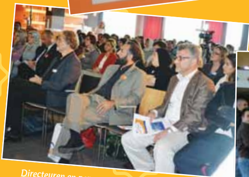
Directeuren en personeel van SIMON scholen worden regelmatig geschoold