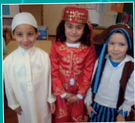
Vieringen op school