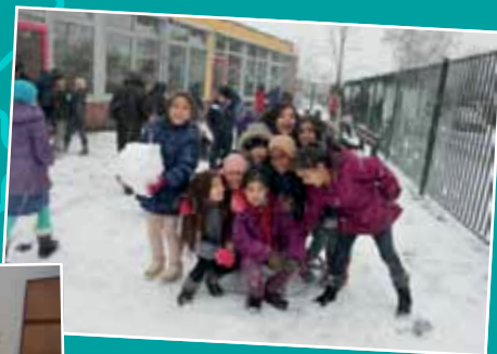
Gezellig spelen op het schoolpein