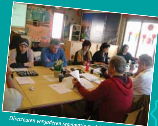
Directeuren vergaderen regelmatig en delen hun ervaring met elkaar