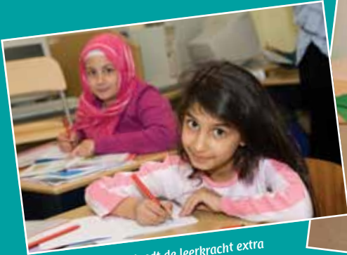
Bij alle lessen besteedt de leerkracht extra aandacht aan de Nederlandse taal