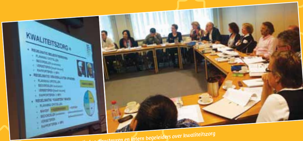
Studiedag directeuren en intern begeleiders over kwaliteitszorg