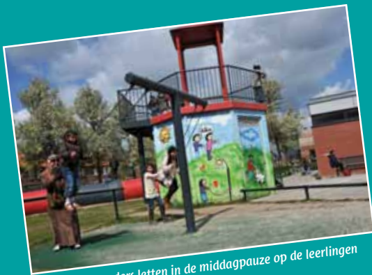
Overblij-ouders letten in de middagpauze op de leerlingen