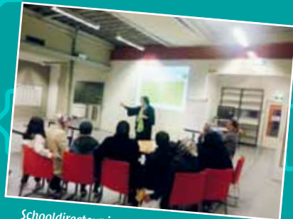
Schooldirecteur in gesprek met ouders tijdens ouderavond