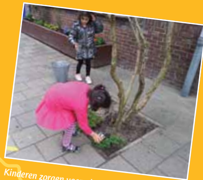
Kinderen zorgen voor planten op het schoolplein