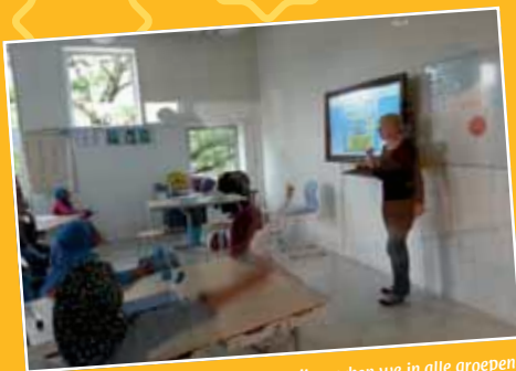
Ter ondersteuning van ons onderwijs werken we in alle groepen met computers en met een digitaal schoolbord