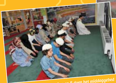
De leerlingen van groep 6, 7 en 8 doen het middaygebed op school