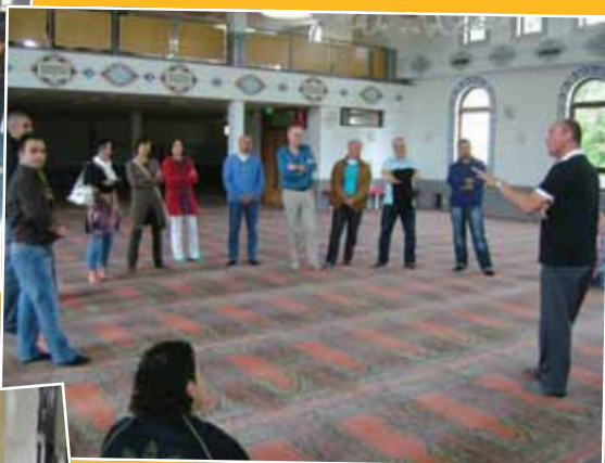
Directeuren op moskeebezoek