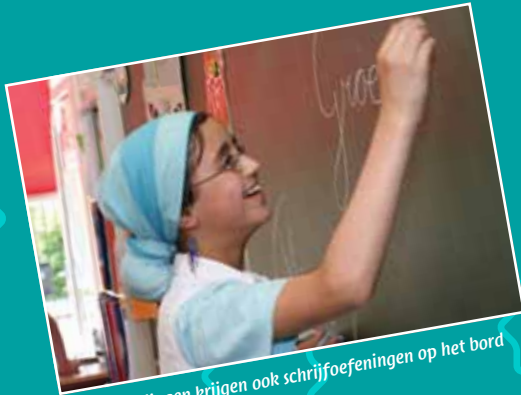
De leerlingen krijgen ook schrijfoefeningen op het bord