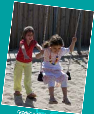
Gezellig spelen in de pauze