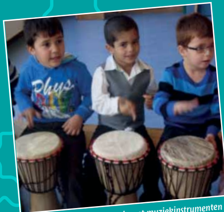
Leerlingen maken kennis met muziekinstrumenten