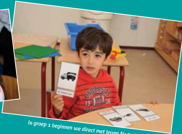
In groep 1 beginnen we direct met lessen Nederlandse taal