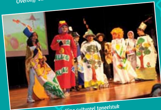
Voorstelling cultureel toneelstuk