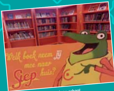
Bibliotheek op school