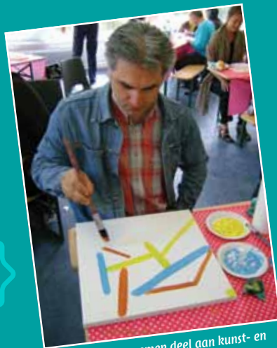
Ook ouders nemen deel aan kunst- en cultuureducatie