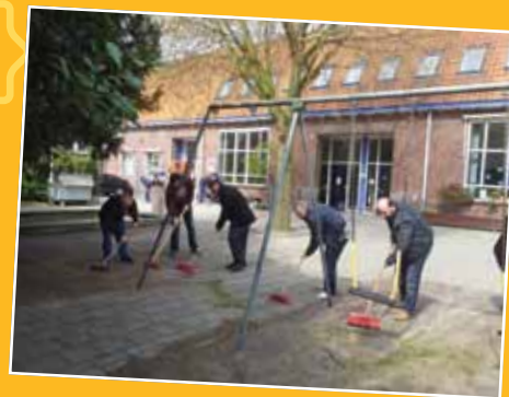
Ouders bezig op schoolplein