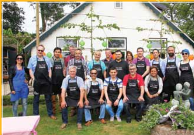
Cvb, RvT, staf en schooldirecties.